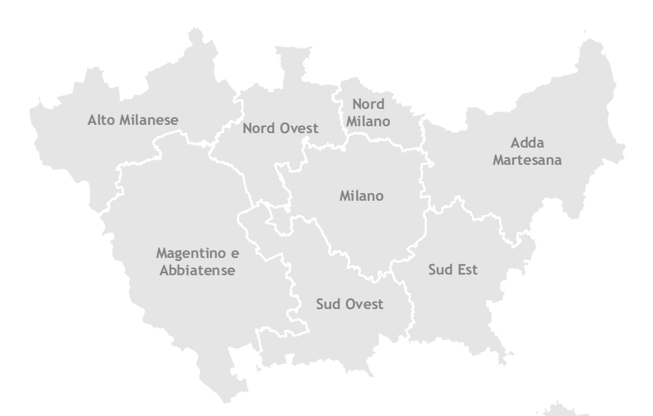
TAVOLA 7 1:70.000