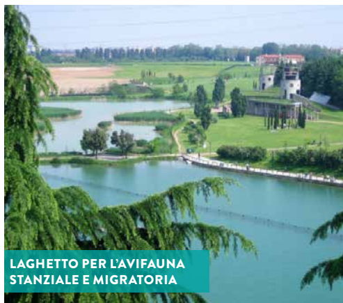
LAGHETTO PER L'AVIFAUNA STANZIALE E MIGRATORIA

Settore risorse idriche e attività estrattive della Città metropolitana di Milano