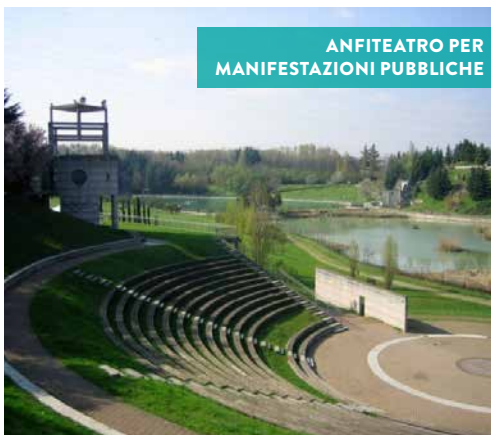
ANFITEATRO PER MANIFESTAZIONI PUBBLICHE