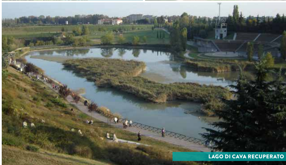
LAGO DI CAVA RECUPERATO