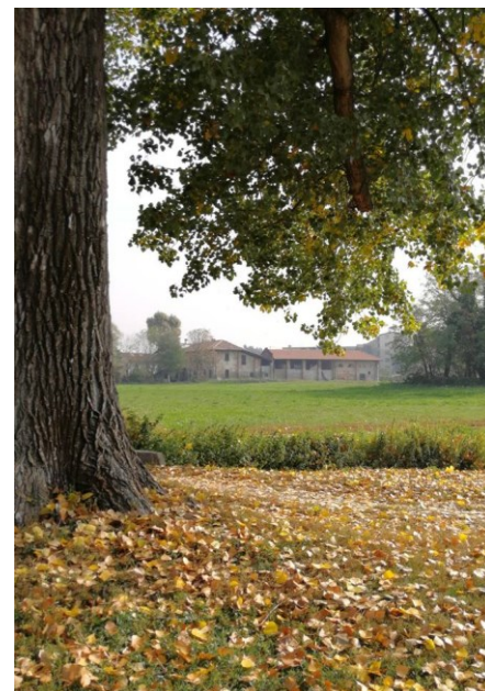
San Martino di Tours, Il Territorio del Parco Agricolo Sud Milano e Cascina Linterno vista dal Parco delle Cave

Autobus 67 (M1 - Bande Nere), 63 (M1 - Bisceglie), 78 (M1 - Bisceglie e M5 - San Siro), 49 (M1 - Inganni e M5 - San Siro)