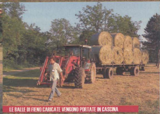
LE BALLE DI FIENO CARICATE VENGONO PORTATE IN CASCINA