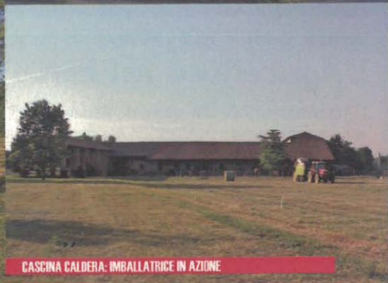
CASCINA CALDERA: IMBALLATRICE IN AZIONE