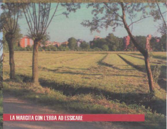
LA MARCITA CON L'ERBA AD ESSICARE