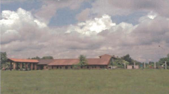
CASCINA CALDERA: IL PRATO NELLA SUA MASSIMA CRESCITA