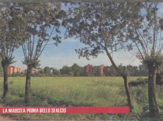
LA MARCITA PRIMA DELLO SFALCIO