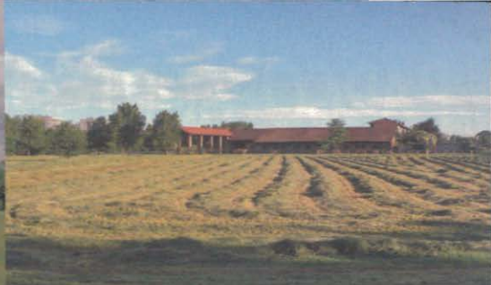
CASCINA CALDERA: L'ERBA TAGLIATA MESSA AD ESSICARE