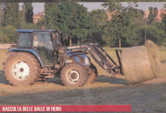
RACCOLTA DELLE BALLE DI FIENO