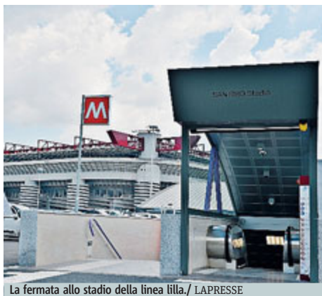
La fermata allo stadio della linea lilla.